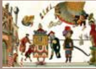
1. © Emmanuel Pierre, Venise Mascarade , Éditions RMN, 2018