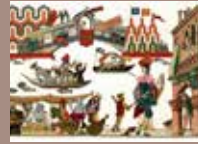
3. © Emmanuel Pierre, Venise Mascarade , Éditions RMN, 2018