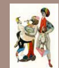
17. © Emmanuel Pierre, Abécédrotique , de François Motte, Editions La Pionnière 2020