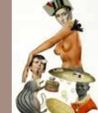
11. © Emmanuel Pierre, Abécédrotique , de François Motte, Editions La Pionnière 2020