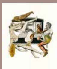
8. © Emmanuel Pierre, Abécédrotique , de François Motte, Editions La Pionnière 2020