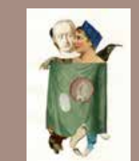
18. © Emmanuel Pierre, Abécédrotique , de François Motte, Editions La Pionnière 2020