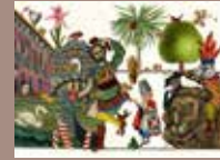
4. © Emmanuel Pierre, Venise Mascarade , Éditions RMN, 2018