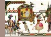
6. © Emmanuel Pierre, Venise Mascarade , Éditions RMN, 2018