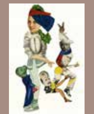
15. © Emmanuel Pierre, Abécédrotique , de François Motte, Editions La Pionnière 2020