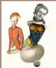
7. © Emmanuel Pierre, Abécédrotique , de François Motte, Editions La Pionnière 2020