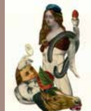
9. © Emmanuel Pierre, Abécédrotique , de François Motte, Editions La Pionnière 2020