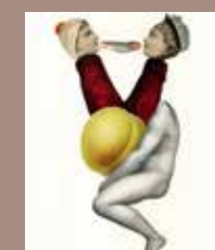
16. © Emmanuel Pierre, Abécédrotique , de François Motte, Editions La Pionnière 2020