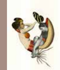
10. © Emmanuel Pierre, Abécédrotique , de François Motte, Editions La Pionnière 2020