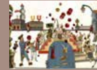
5. © Emmanuel Pierre, Venise Mascarade , Éditions RMN, 2018