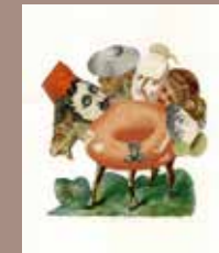
12. © Emmanuel Pierre, Abécédrotique , de François Motte, Editions La Pionnière 2020