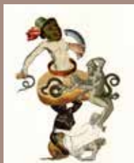
13. © Emmanuel Pierre, Abécédrotique , de François Motte, Editions La Pionnière 2020