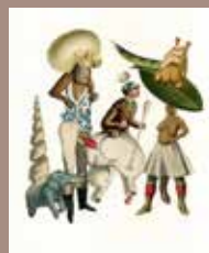
14. © Emmanuel Pierre, Abécédrotique , de François Motte, Editions La Pionnière 2020