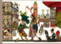
2. © Emmanuel Pierre, Venise Mascarade , Éditions RMN, 2018